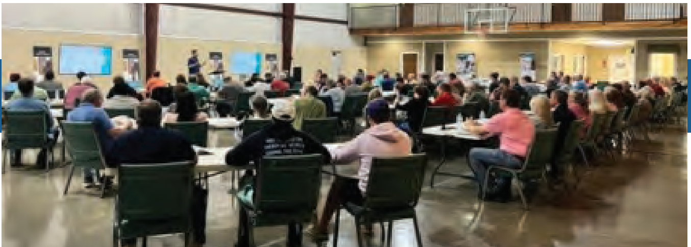
El curso "La vida personal del ministro" del PFM siendo enseñado a pastores, ministros y plantadores de iglesias en Alabama.

Me siento sumamente agradecido por la obra de amor que han realizado los líderes de la Iglesia de Dios de la Profecía y el departamento de Desarrollo del Liderazgo y Discipulado en proporcionar el PFM a nuestro cuerpo global de la Iglesia. Por medio de este maravilloso programa, Dios nos empoderará para cumplir Su misión de reconciliar al mundo con Cristo. Únase conmigo en oración y participación en este programa dinámico para equipar a los pastores, ministros, plantadores de iglesias y líderes de la Iglesia de Dios de la Profecía.